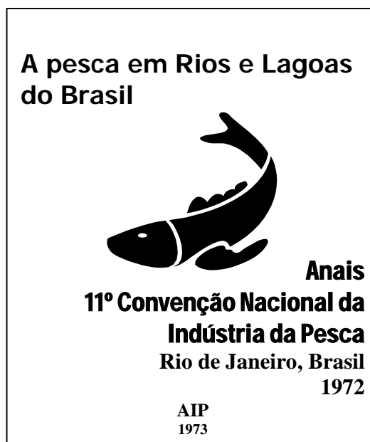
Serie monográfica -- cada número tiene un título temático